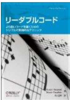
リーダブルコード -より良いコードを書くためのシンプルで実践的なテクニック (Theory in practice)