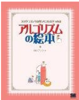
アルゴリズムの絵本 プログラミングが好きになる9つの扉

ユーザーから遅いと言われたら、速く動く アルゴリズム を考えたり、実装方法を工夫して速くなるように作り直さなければいけません。