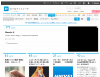
はてなブックマーク

ブログのプロフィールにも同じ写真を出しておいたり、ソーシャルのリンクも欲しいですね。うちの子たちを紹介しておきましょう。